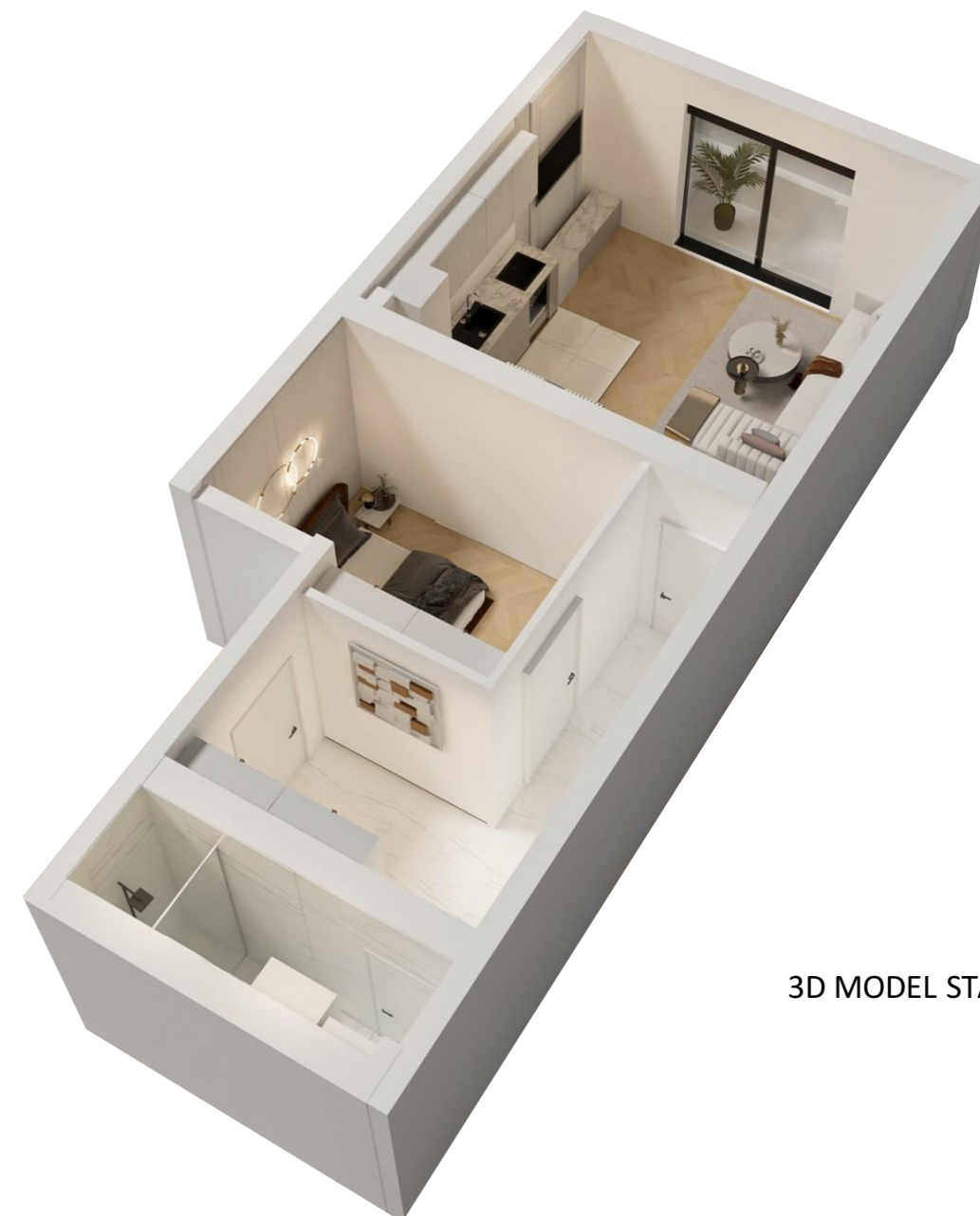
3D MODEL STANA

- OSNOVA TIPSKE ETAZE I-IX SPRATA - Stanovi: 8, 23, 38, 53, 68, 83, 98, 113, 128.